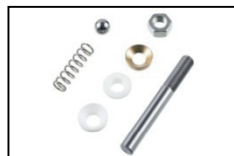
Service-Set Pumpe Service-Set pump Order-No. BM1135