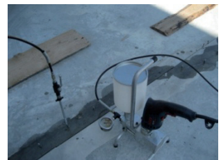
1-K-PUR, 2-K-PUR, 2-K-Epoxidharz 1 and 2 comp. PUR and epoxy resins

Hochdruck-Bohrmaschinen-Pumpen bis 400 bar High pressure pumps up to 400 bar