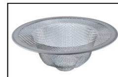
Sieb für Behälter Strainer for hopper Order-No. BM 1134