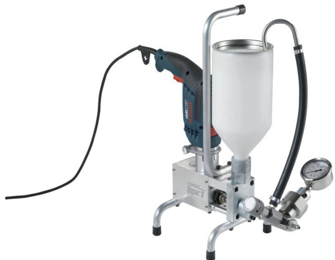
Jumper II max. 250 bar mit Druckeinstellung und Druckmittler Pressure adjustable, with safety gauge