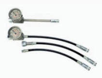
Injektionszubehör HP injection sets