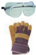
Arbeitsschutz Work protection