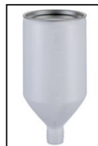
Behälter m.Deckel Hopper with cover BM 1132 + 'BM 1133