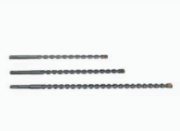
SDS - Bohrer Drillers