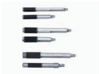
Packersysteme Injection packers