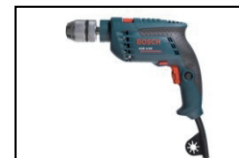
Bohrmaschine 600 W Driller 230 V – 600 W Order-No. BM0601217100