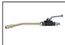
Injekt-Set Kugelhahn Injection set ball tap Order-No. BM 1137