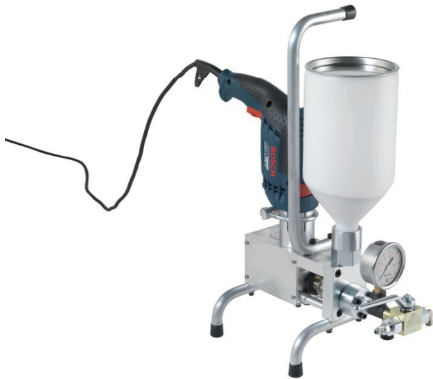
Jumper I max. 400 bar ohne Druckeinstellung without pressure adjustment