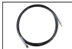
HD-Schlauch 5 mtr HP-hose 5 mtr Order-No. BM1136